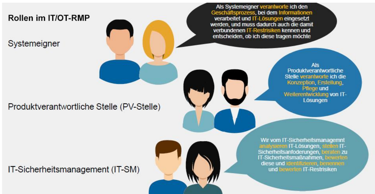
Abb.: Beispiel IT/OT-RMP der Deutschen Bundesbank

In dem folgenden Leitfaden sind „Rollen-Karten“ als Module passend zu einer Bedarfsanalyse und den jeweiligen Leistungsphasen der HOAI visualisiert.